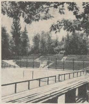
Jede Sektion würde sich glücklich schätzen so einen M.-Platz zu besitzen wie Friedrichshagen. Für Turniere wie geschaffen. Kommentar erübrigt sich!

Seit zwei Jahren werden besonders große Anstrengungen unternommen, um die allgemeine Turniermüdigkeit – bis auf die berühmten Ausnahmen – durch Erweiterung des Wettkampfbetriebes zu überwinden.