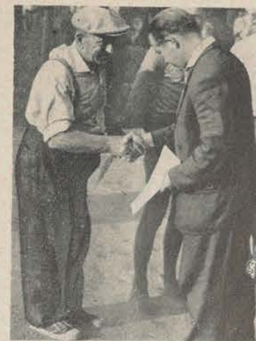
Ehre wem Ehre gebührt! Ein nettes Wort oder eine liebenswürdige Geste geben jedem Mitarbeiter neuen Auftrieb, sich für unseren Sport voll einzusetzen.

Ein anderes Beispiel: „Im vergangenen Jahr haben wir zu unseren zwei Plätzen ein Kleinfeldtennisplatz hinzugebaut. Aber wir bekommen einfach keine Kinder auf diesen Platz“, war auf der Kreisdelegiertenkonferenz in Karl-Marx-Stadt der Stoßseufer der Sektionsleiterin der BSG Wismut. „Haben sie denn keinen Jugendleiter?“, kam es aus der gut besuchten Versammlung. – „Nein, ich mache praktisch die gesamte Arbeit allein!“ Staunen bei den einen, Kopfschütteln bei den anderen, womit sie ausdrückten, auch uns geht es nicht viel besser.